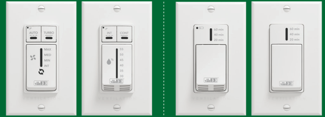
Commande automatique 41304